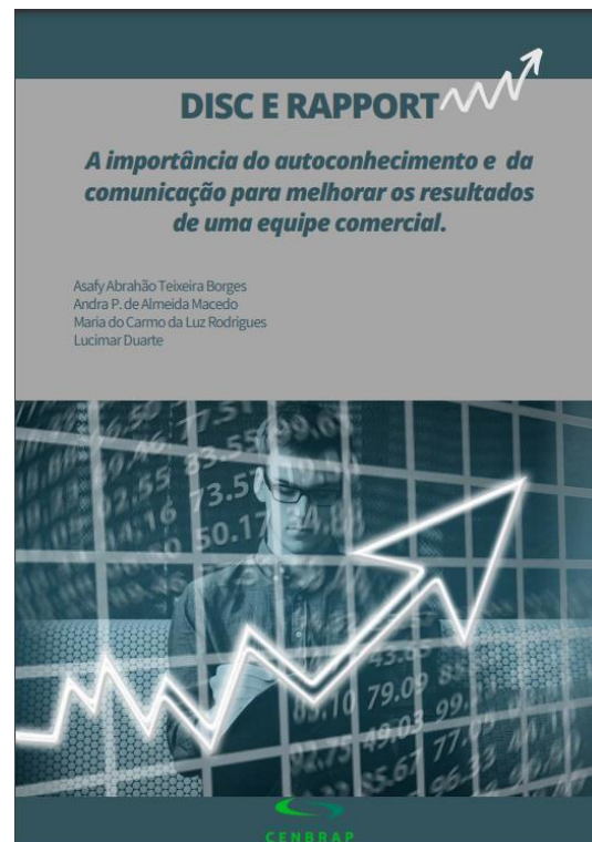
Figura 17: Ação de Extensão Universitária 2022/1 – Grupo 4 – E-book do treinamento.