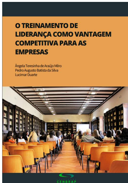
Figura 16: Ação de Extensão Universitária 2022/1 – Grupo 3 – E-book do treinamento.