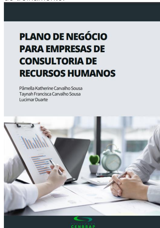
Figura 19: Ação de Extensão Universitária 2022/1 – Grupo 6 – E-book do treinamento.