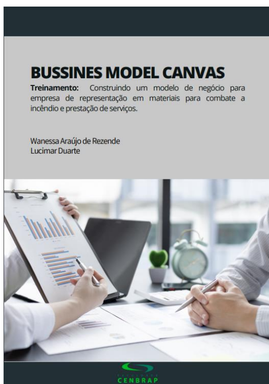
Figura 14: Ação de Extensão Universitária 2022/1 – Grupo 1 – E-book do treinamento.

Foram selecionadas pela turma seis empresas, as quais responderam o formulário de diagnóstico. A partir das respostas os alunos produziram um treinamento contendo e-book e videoaula gravada (Figuras 14 a 18). Os treinamentos produzidos foram entregues para as empresas e ficaram disponíveis de livre acesso no Projeto Universidade Corporativa da Faculdade CENBRAP.