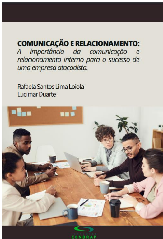
Figura 15: Ação de Extensão Universitária 2022/1 – Grupo 2 – E-book do treinamento.